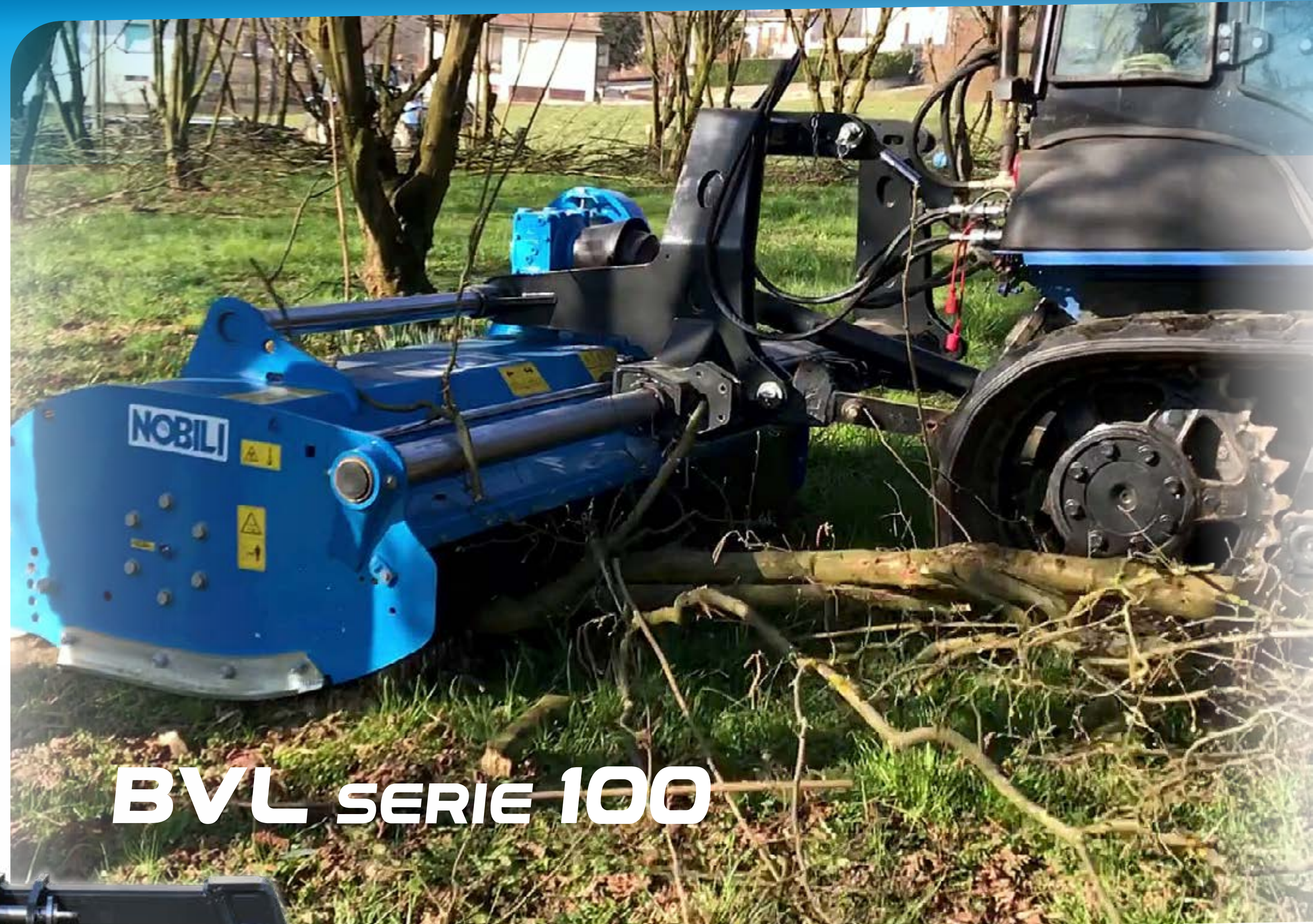
BVL SERIE 100