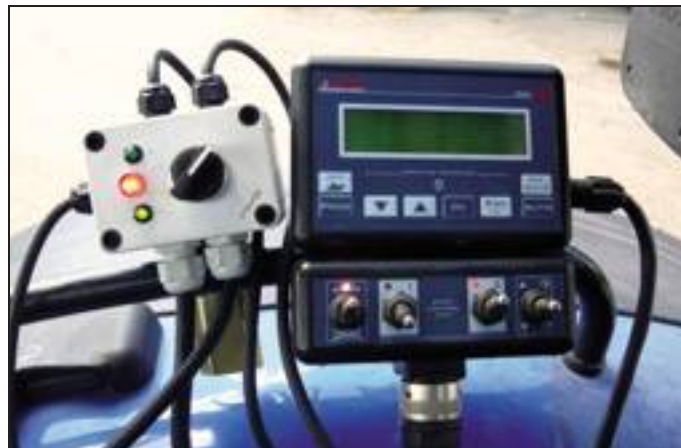
[ 6. Irrorazione elettrostatica. Controllo in continuo per monitorare la funzionalità del sistema.

km/h, quando invece si è in presenza di una intensa vegetazione sono consigliabili velocità più ridotte (4-5 km/h). La tipologia di ugello influisce sulla dimensione delle gocce prodotte, sulla direzione con la quale vengono erogate e quindi sulla loro capacità di penetrazione all'interno della vegetazione. Ugelli usurati sono causa di sovradosaggi (per incremento della portata), distribuzione disuniforme sul bersaglio (a causa della non corretta sovrapposizione dei getti), minore copertura del bersaglio. Per queste ragioni è auspicabile impiegare ugelli certificati ed effettuare una loro verifica e sostituzione periodica. L'incremento della pressione di esercizio determina un aumento della portata ed una maggiore polverizzazione del liquido, con produzione di gocce diametralmente più ridotte. Dal punto di vista operativo è auspicabile lavorare a pressioni che vanno da 4 a 10 bar e, soprattutto, è necessario sottoporre a controllo periodico il manometro.