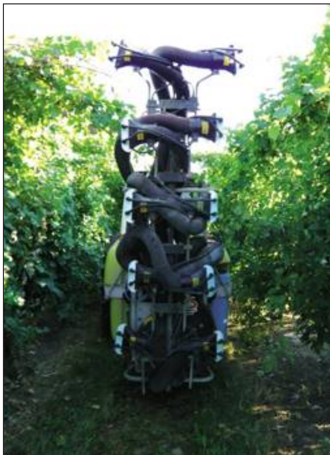
[ 5. Atomizzatore a getti orientabili dotato di dispositivi per l'applicazione della carica elettrostatica.

operando a filari alterni aumentano notevolmente le dispersioni fuori "bersaglio". Il modo di operare corretto prevede sempre il passaggio della macchina in tutti i filari.