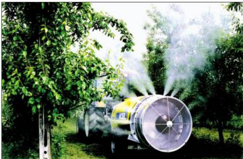
[ 1. Atomizzatore tradizionale. La conformazione limita la possibilità di orientamento del getto.

La quantità di aria prodotta dai ventilatori risulta molto spesso insufficiente, soprattutto quando le velocità di avanzamento sono elevate. Negli atomizzatori tradizionali il problema è dato, d'altronde, dalla limitata possibilità di regolazione del flusso di aria, in genere il ventilatore presenta un cambio a due velocità. Il rapporto aria-vegetazione rappresenta un parametro molto importante, infatti, l'aria dovrebbe avere una portata ed una velocità tali da penetrare la chioma senza oltrepassarla e consentire, in tal modo, la corretta deposizione su entrambi i lati della foglia.